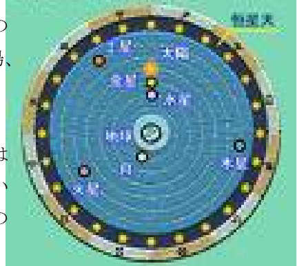
プトレマイオスの宇宙

プトレマイオスの天動説は、中世まで西洋での宇宙観の基本でした。当時のキリスト教神学でも人間の住む地球は宇宙の中心であるのにふさわしいと考えられていたので、その天動説に異議をとねるのは、相当の覚悟が必要だったのです。